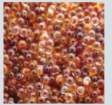
イオン交換樹脂(拡大写真)

最高品質のイオン交換樹脂を使用。浄水器では取除けない陽イオン・陰イオンどちらのイオン化物質も完全に除去します。