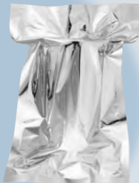
ハードケース(架台) 専用カートリッジ(保管袋入り) (カートリッジ交換時期チェック用の試薬付き)